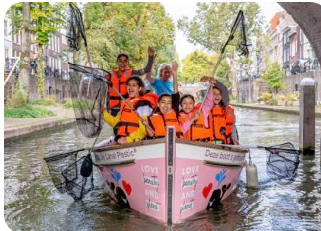
DONEER AAN ONZE FOUNDATION