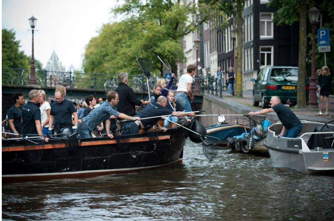
Boven: Fanatieke plasticvissers. Onder: Groepsprestatie.